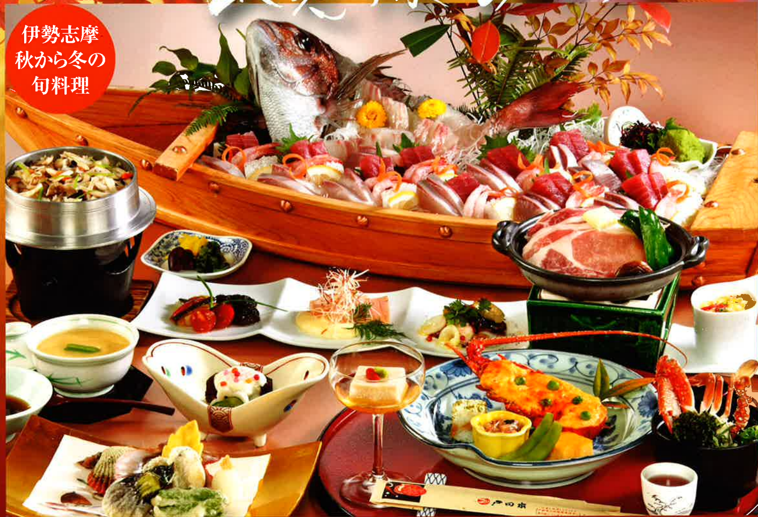
※写真の舟盛りは10名様盛りです。

南館「きららルーム」 月曜～木曜日特別宿泊企画 平成23年10月1日～平成24年3月31日まで ※休前日・正月期間は除きます。 ※入湯税(大人1名様150円)を別途承ります。 10名様以上でお申込みください。