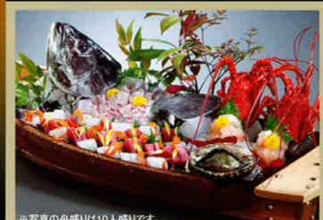
※写真の舟盛りは10人盛りです。 お造りは舟盛りに変更することもできます。