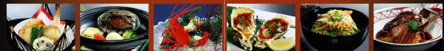
河豚の唐揚(2個) 1,575円 姫鮑ステーキ 3,150円 伊勢海老姿造り 9,450円 牡蠣洋風焼(2個) 1,050円 青さ搔揚げそば 1,050円 鯛あら炊き 2,100円