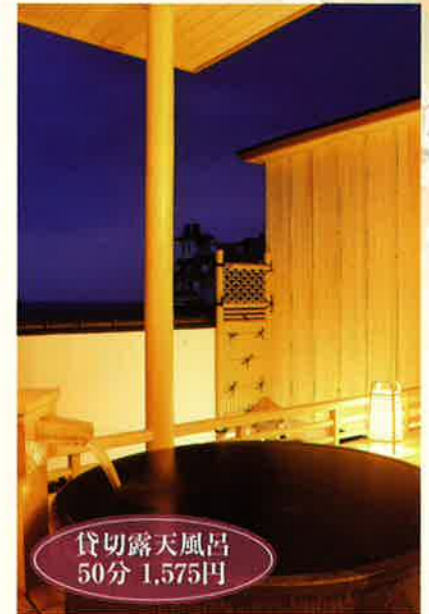
貸切露天風呂 50分 1,575円