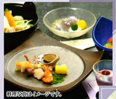
料理写真はイメージです。