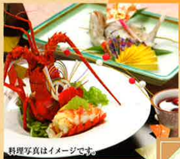
料理写真はイメージです。

長寿のお祝いではシンボルカラーに合わせた「ちゃんちゃんこ」をご用意しております。