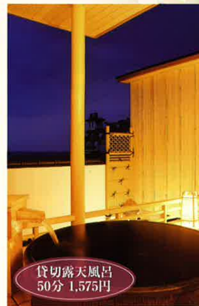
貸切露天風呂 50分 1,575円